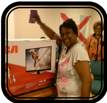
Ganador de un 32 "pantalla plana de TV!