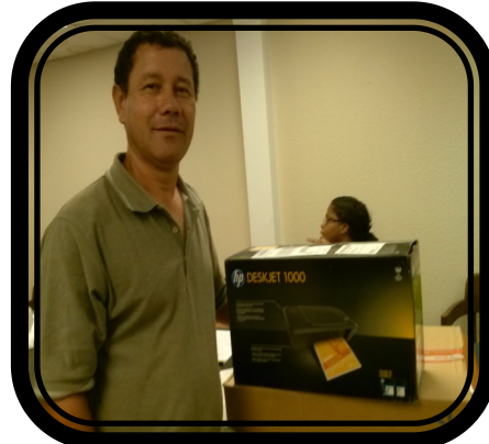
Ganador del Portátil Multi Media Set